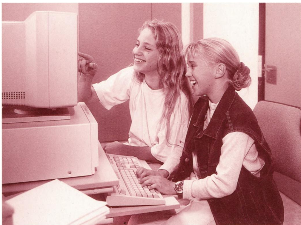
Pararbejde med fokus på skriveprocessen.

Denne arbejdsform lægger også naturligt op til, at det færdige produkt kan anvendes i nye sammenhænge i eller uden for undervisningen. Det kan fx ske i form af små breve og meddelelser til de andre elever i klassen, som de skal reagere på, eller det kan være breve til pennevenner i parallelklassen, som man leger kommer fra en anden planet, eller til elever, der virkelig bor i andre lande. Det kan være, at man i en periode skriver med elever fra en anden skole, eller at eleverne skriver