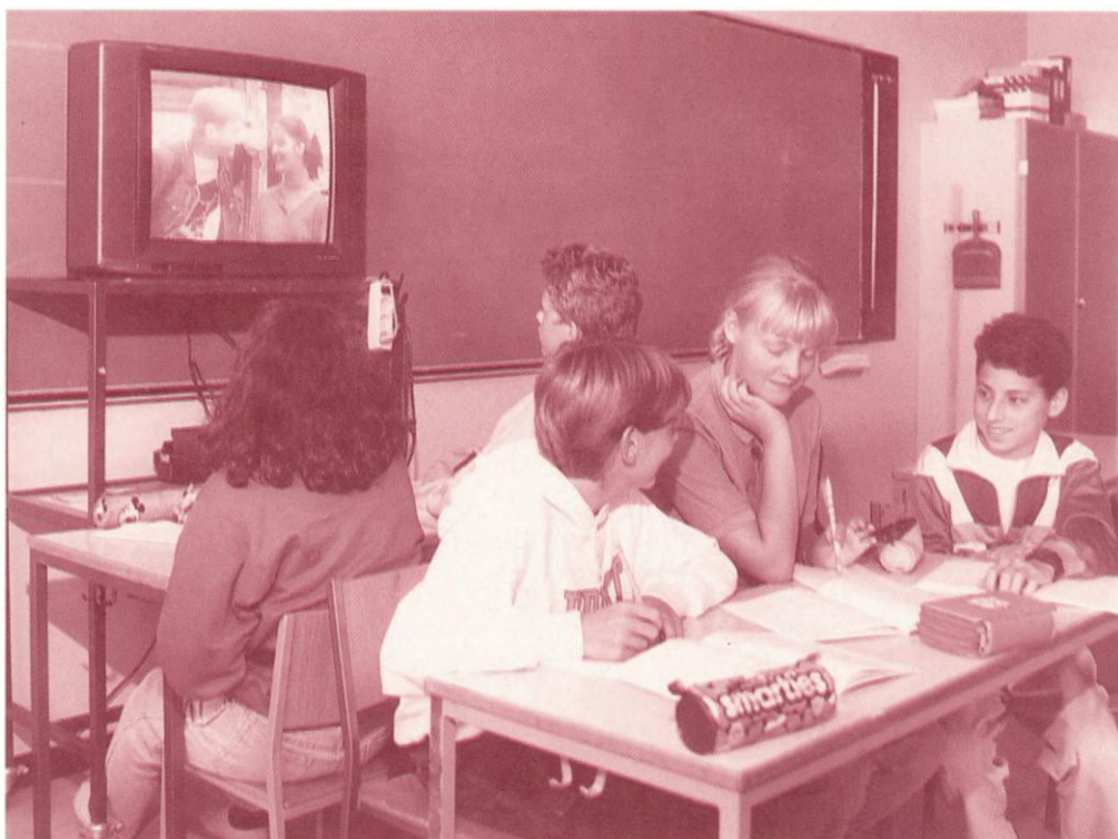
»Læg-mærke-til-opgave« om sprogets virkemidler.

I Danmark lærer børn ikke blot fremmedsprog i skolen. Længe inden engelskundervisningen sætter ind, har børnene gennem tv, video, musik og spil et temmeligt stort kendskab til engelsk.