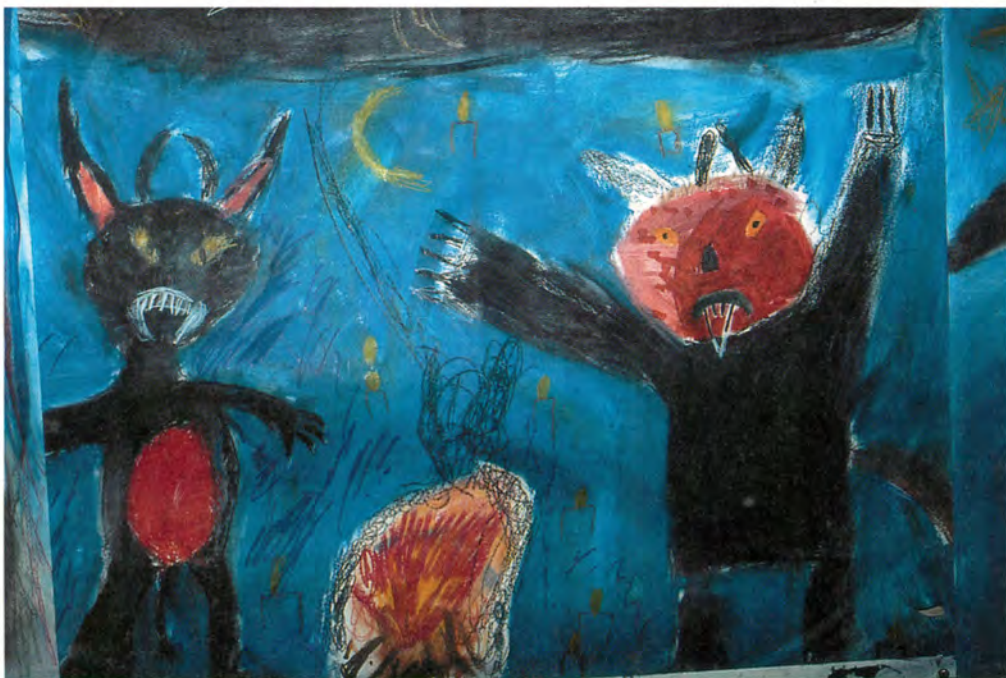
1. klasse har arbejdet med at dramatisere emnet »Trolde« til musik.

Der er forskellige tilgange til billedarbejdet. Når eleverne sanser og bruger deres opmærksomhed målrettet, kom-