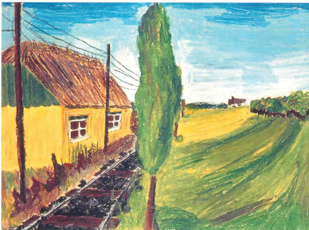
8. kl. har arbejdet med perspektivtegning. "Langs jernbanen".

nødvendigt, for at de kan opleve betydningen af deres arbejde. Der bør derfor anvendes materialer og værktøj af god kvalitet, der er med til at signalere det seriøse, og at elevernes arbejde tages alvorligt. Det er naturligt, at eleverne stifter bekendtskab med farvelære, stofflige og strukturgivende materialer, og hvordan der kan skabes rum i billeder både ved hjælp af farver og perspektiviske linievirkninger. Det kræver viden og forståelse. Voksenkunsten inddrages som demonstrationsmateriale, og er med til at udvikle den æstetiske dannelse og elevens forhold til eget udtryk. Derudover viser et