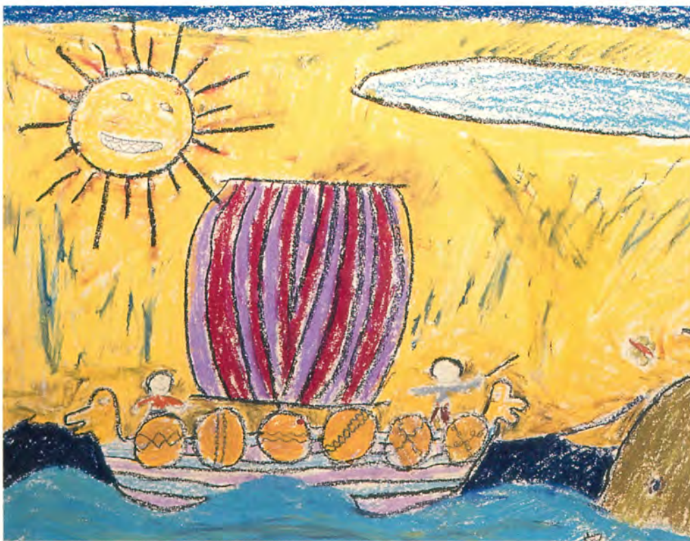
2. kl. har talt om Svend Tveskæg og vikingetiden. "Den danske flåde står ud".

Stk. 3. Som led i deres æstetiske udvikling og som medskabere af kultur udvikler eleverne fortrolighed med kunstens og massekulturens billedformer, og de forstår betydningen heraf i egen og i fremmede kulturer.