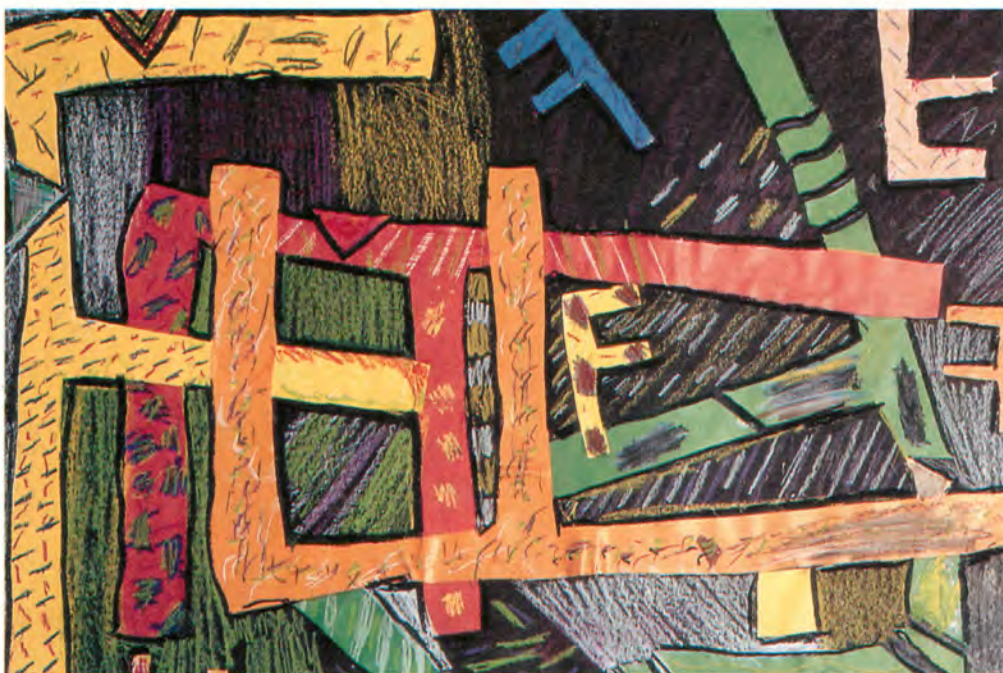
5. klasse har arbejdet abstrakt. Eleven har valgt et F og brugt det i en komposition.

mer de i kontakt med vidt forskellige oplevelsesområder. Det har betydning for billedernes indhold og form.