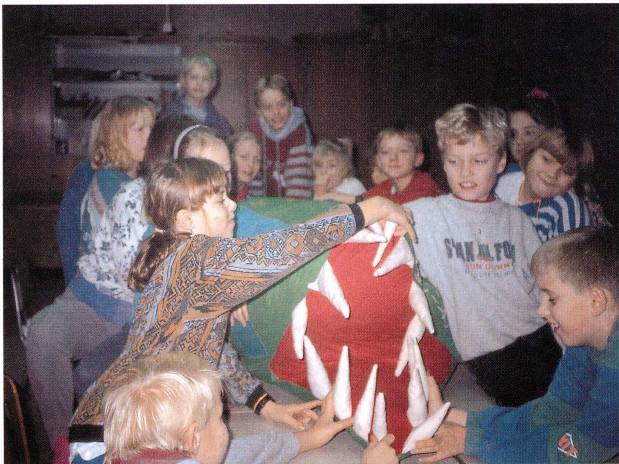
Egtved Skole: Et stort dyr.

Eleverne vil i fællesskab fremstille et stort, 2-3 meter langt, rumligt dyr – en krokodille, gravhund, skildpadde eller fantasidyr til at sidde på eller lege med i klassen. Komposition og far-