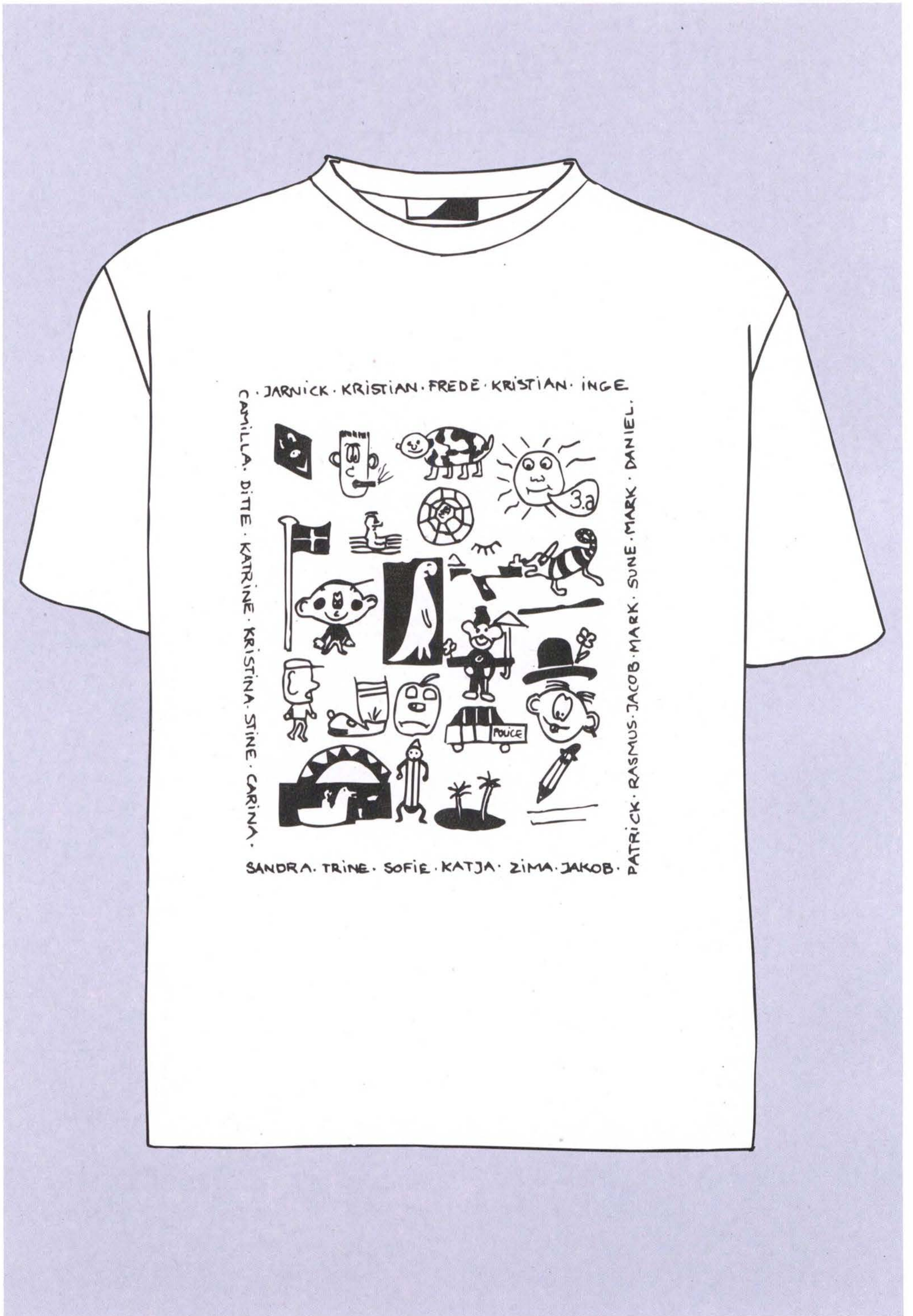
Klassens egen T-shirt. Tegning Ann Merete Ohrt.