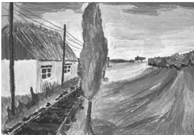
8. klasse har arbejdet med perspektivtegning “Langs Jernbanen”.

Sådanne studier kan ligeledes danne basis for billeder, hvor emnet bearbejdes nonfigurativt, ved at farvevalg, komposition og rytme refererer til de unges fredag aften. Eleverne kan undersøge, hvilke former de opfatter som organiske, og som refererer til det bevægelige, og hvilke der refererer til geometriske former i diskoteket.